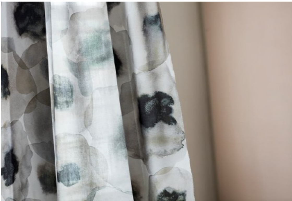
SUMIRE Hanging fabrics