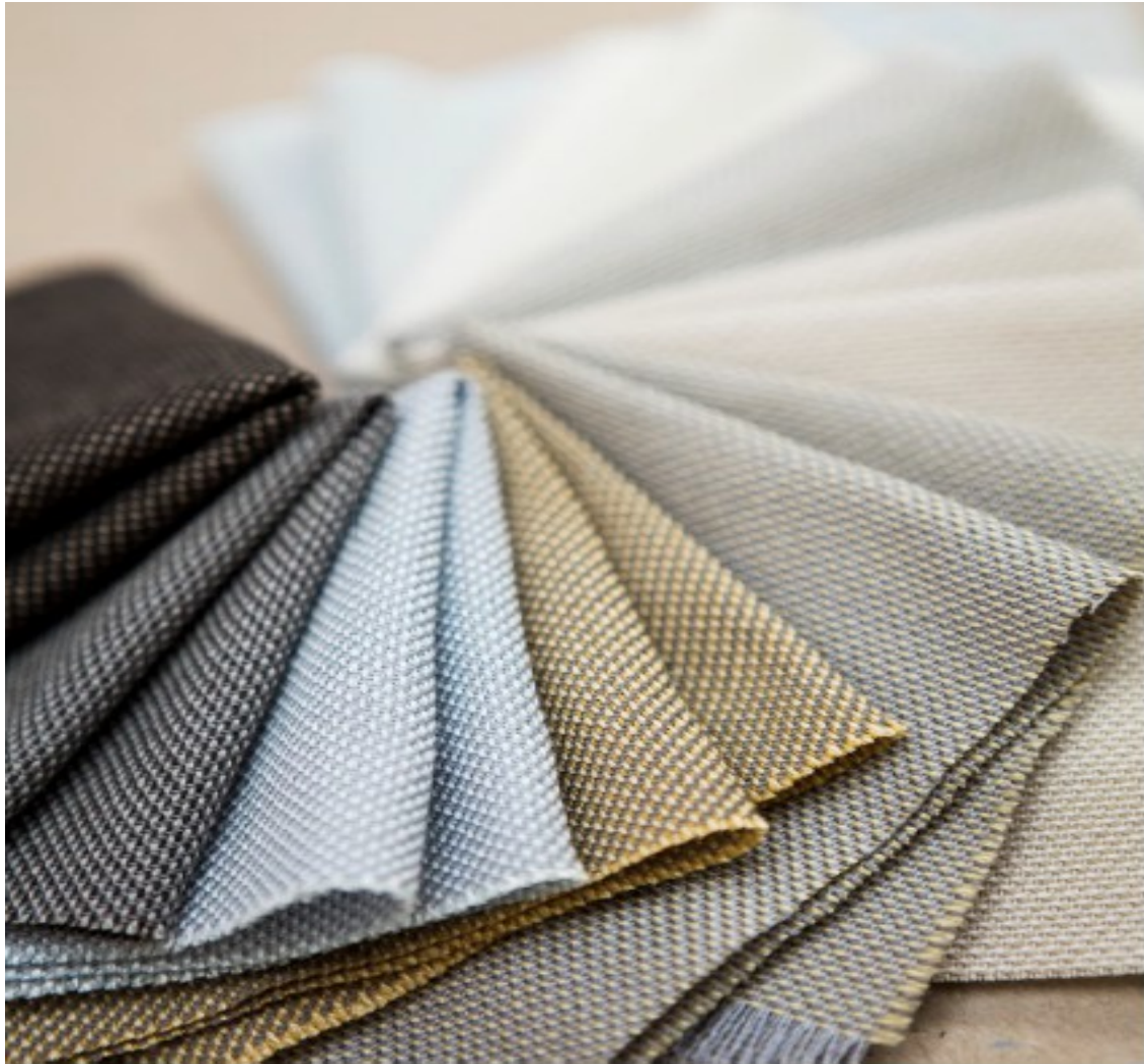
GRAIN Hanging fabrics