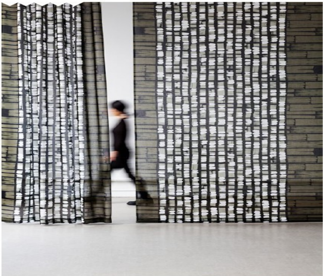
AKI Hanging fabrics