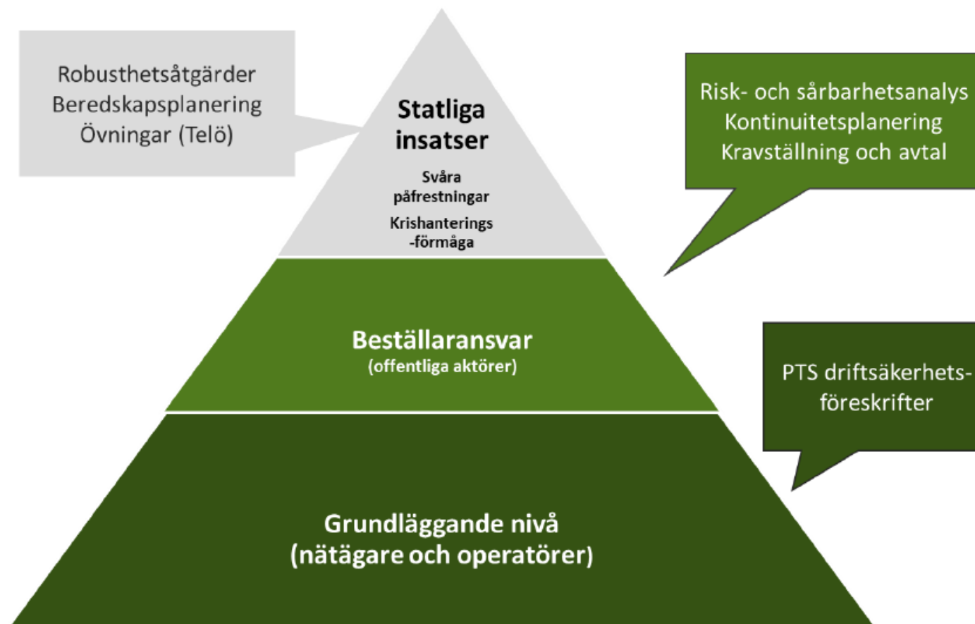
Figur 8: Modell för samhällets ansvar för en robust infrastruktur för elektronisk kommunikation.