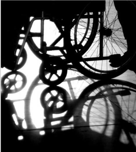
Diskriminering 100 och 111