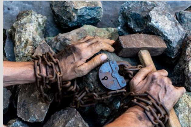
Tvångsarbete 29 och 105