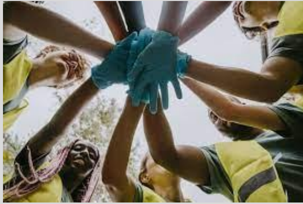
Föreningsfrihet 87 och 98