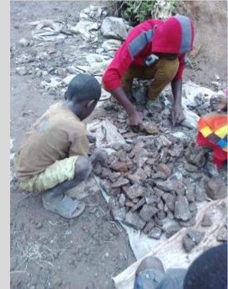
Barnarbete 138 och 182