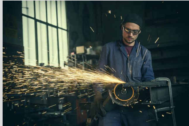
Arbetsmiljö 155 och 187