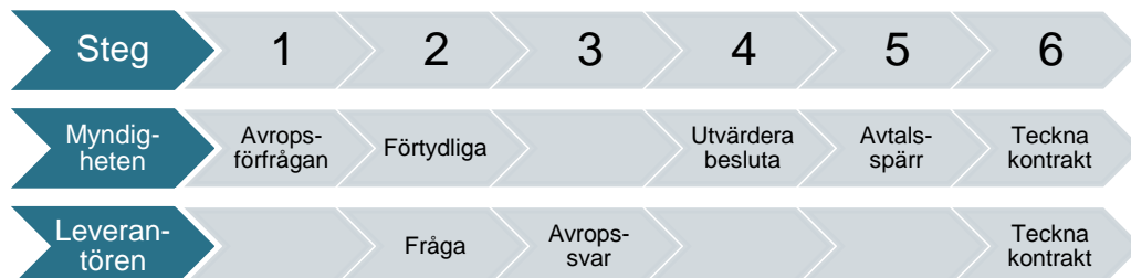
Tabell 4. Arbetsgång vid avrop