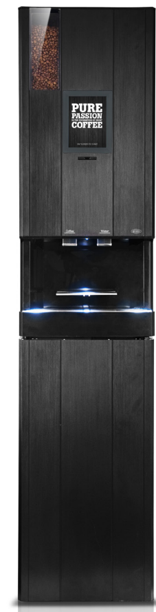
CQube LF13 Touch Screen med underskåp