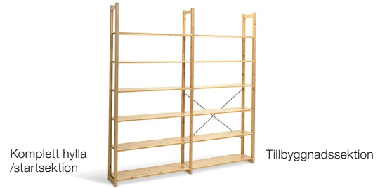
Komplett hylla /startsektion